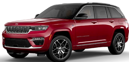
Velvet Red (punainen)