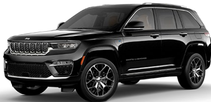
Diamond Black (musta)