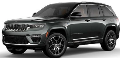
Baltic Grey (harmaa)