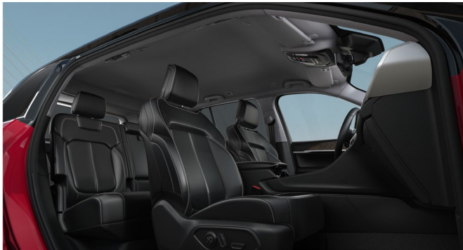
Istuimien musta nahka-/vinyyliverhoilu 'Capri'