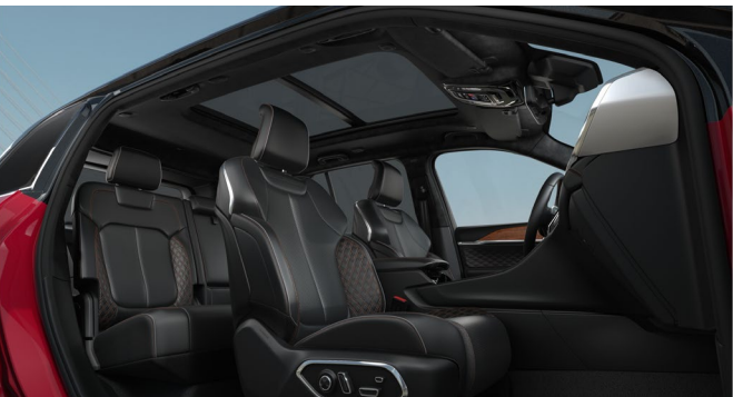
Istuimien musta nahkaverhoilu 'Palermo'