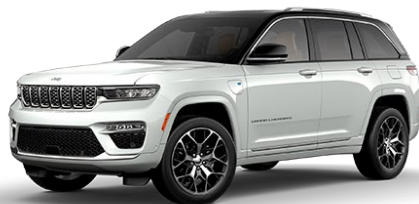
Bright White (valkoinen)