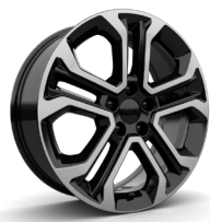
18" | Altitude optio