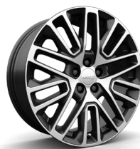
19" | Summit