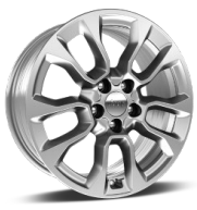
17" | Altitude