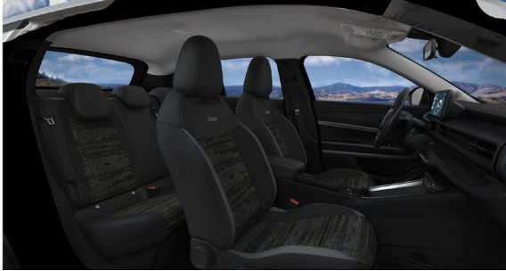
Istuimien harmaa kangas-/vinyyliverhoilu 'Digital Jane'